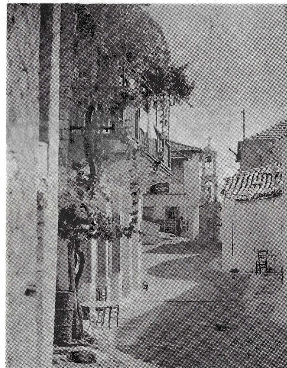
Ὠραιότατη ἐσωτερικὴ φωτογραφία τοῦ Ἰσορι, παρμένη ἀπὸ τὴν κεντρικὴ βρύση. Στὸ βάθος τὸ ταχυδρομεῖο καὶ τὸ κωδωνοστάσιο τοῦ Ἁγιο Νικόλα.

Ἀπὸ τὶς κορφές πού εἶναι κτισμένο, ὁ ἀπὸ θεόρατο μπαλκόνι ἀγγναντεύει τὰ