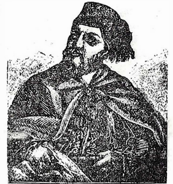
Ὁ φοβερός Ἰμβραήμ

Ἡ μάχη διήρκεσεν ἑπτὰ ὥρας καὶ ἡ διάβασις τῶν διόδων ὑπὸ τοῦ ἔχθρου